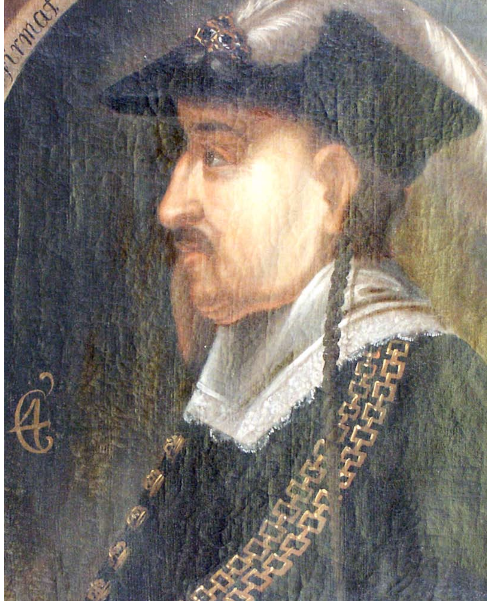
Christian 4. Olie på lærred, højde 70 cm bredde 58 cm. Påskrevet: Regna Firmat / pietas viuit (Fromhed styrker rigerne). Kopi efter original af Karel van Mander, 1647. Christian 4. fik i slaget ved Kolberger Heide læderet højre side af ansigtet og mistede det højre øje, og han foretrak derefter at blive malet i profil. Museum Sønderjylland.

Victors jomfrurejse var i 1599, på det berømte togt til Nordkap, hvor kongen rejste incognito – af sikkerhedsmæssige årsager – som »Generalkaptajn Christian