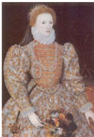
Elizabeth I af England. Hyrede hun John Dowland til at agere spion?